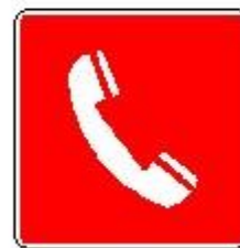
Telefono per interventi antincendio